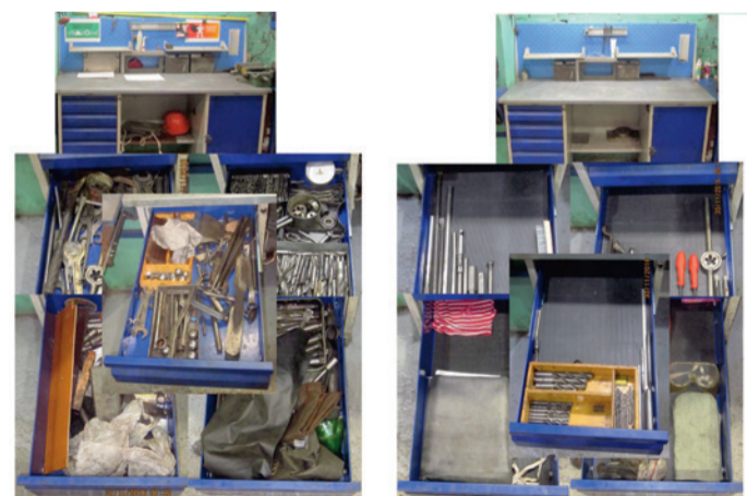
Внедрение системы «5С» в слесарных мастерских Службы пути