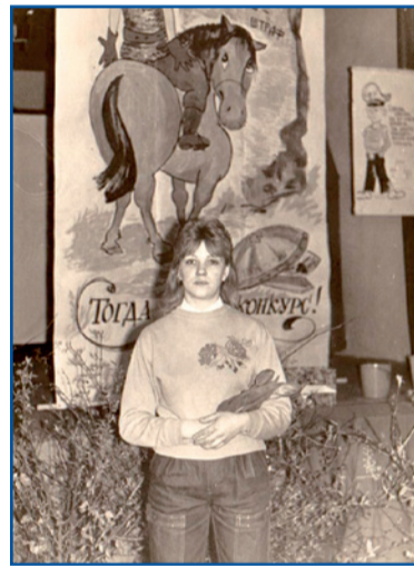
На конкурсе молодых водителей. 1989 г.

О том, что думают о любви другие женщины Горэлектротранса – читайте на 4-й полосе.